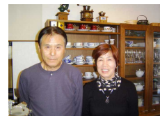
お待ちしております!